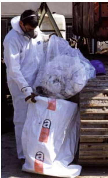
Les opérations de désamiantage nécessitent des protections adéquates.